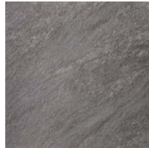
R11 60x 60 cm