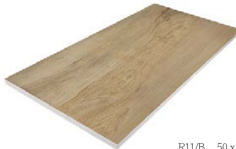
R11/B 50 x 100 cm