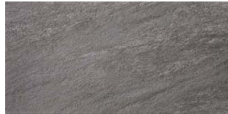
R11 45 x 90 cm