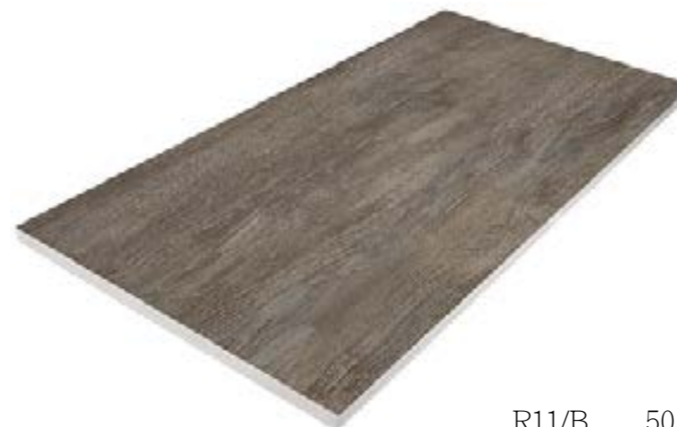
R11/B 50 x 100 cm