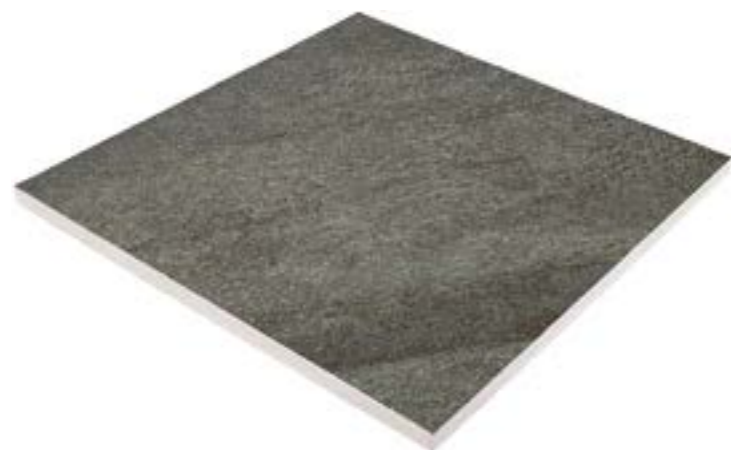
R11/B 60 x 60 cm