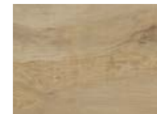
natural oak 天然橡木色