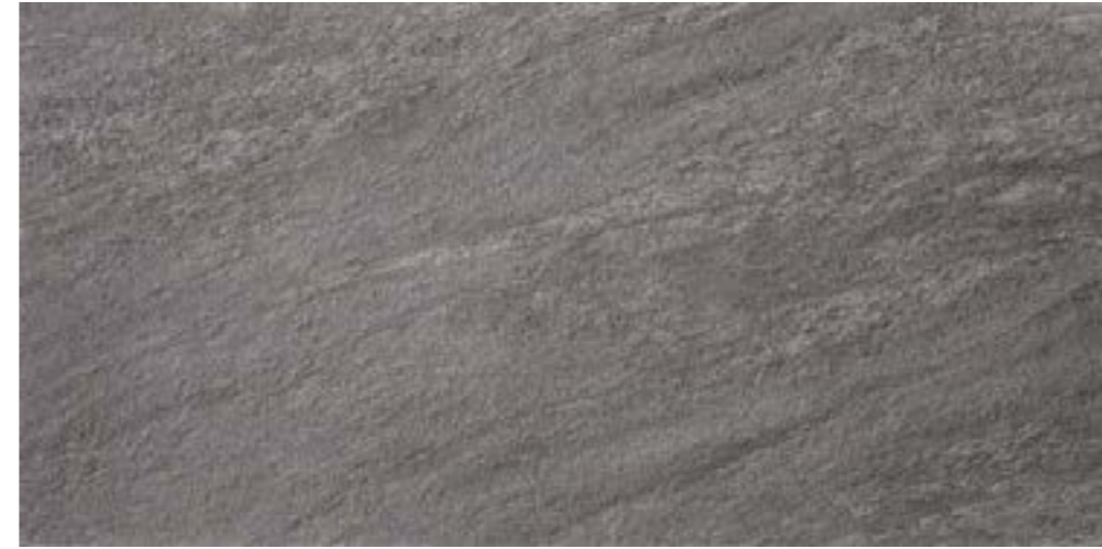
R11 60 x 120 cm